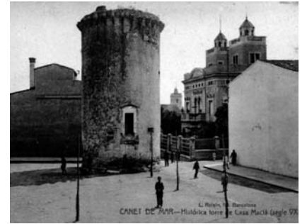
Plaça Macià. AMCNM

«La corte del faraón» de l'any 1910. A càrrec dels/les alumnes de l'Aula de Cant de Canet de Mar.