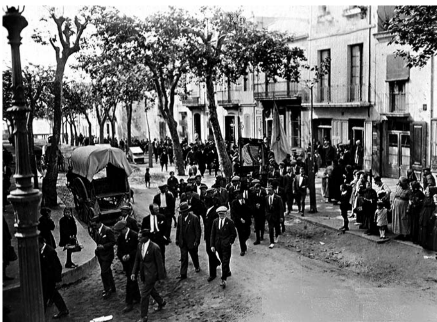
Riera Sant Domènec.

Sala Cultural Ramon de Capmany. Del 7 al 17 de setembre.