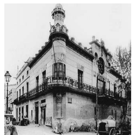
Ateneu de Canet. CEDIM