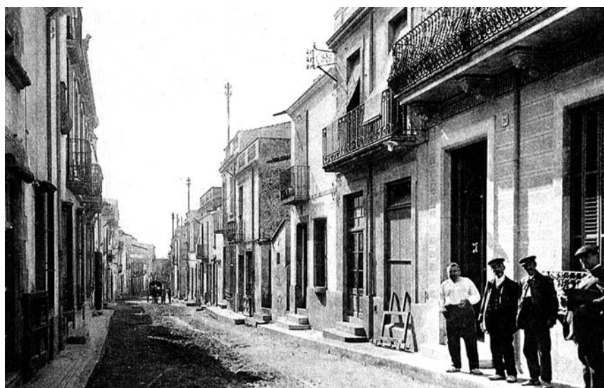
Riera Buscarons, a inicis de segle XX. CEDIM

Preu: 10€ adults / 6€ nens de 6 a 14 anys, estudiants i jubilats.