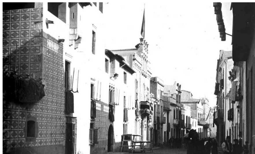
El carrer Ample, el 1909.

Preu: 10€ adults / 6€ nens de 6 a 14 anys, estudiants i jubilats.