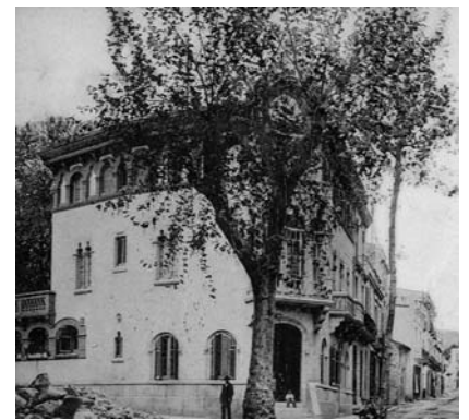
Casa Domènech. CEDIM

Preu: 20 euros. Hi haurà servei de bar durant tot el ball.