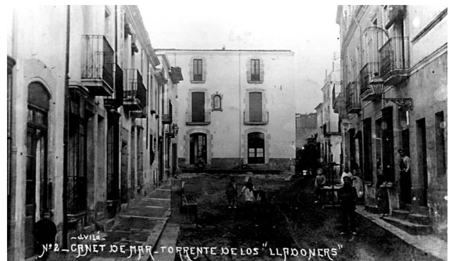
Torrent de Lledoners. CEDIM

Escenari Cafè Teatre. Plaça Universitat.