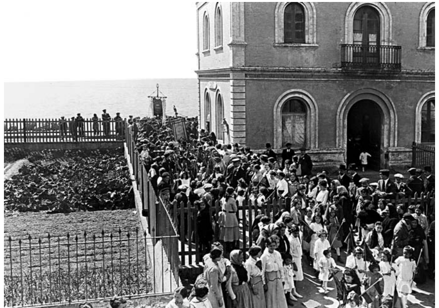
Estació de Canet, a inicis de segle XX. Fons «La Caixa»